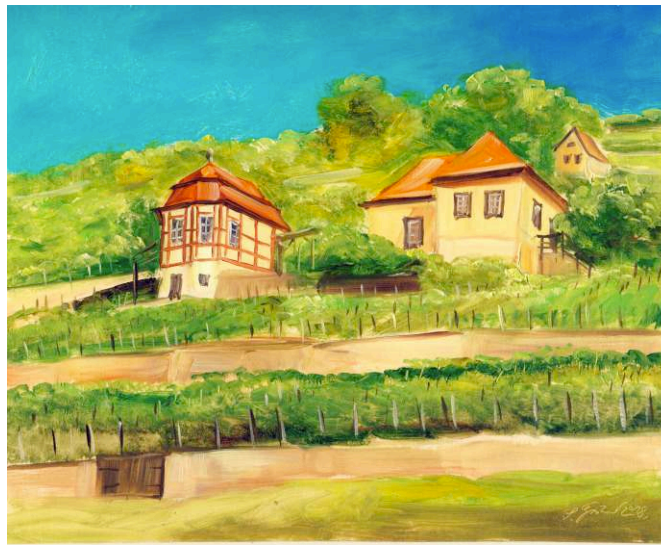
Weinberghäuschen in Freyburg